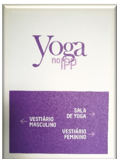
Anexo 3 - Sinalética