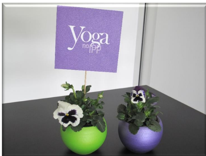
Anexo 2 - Decoração do espaço