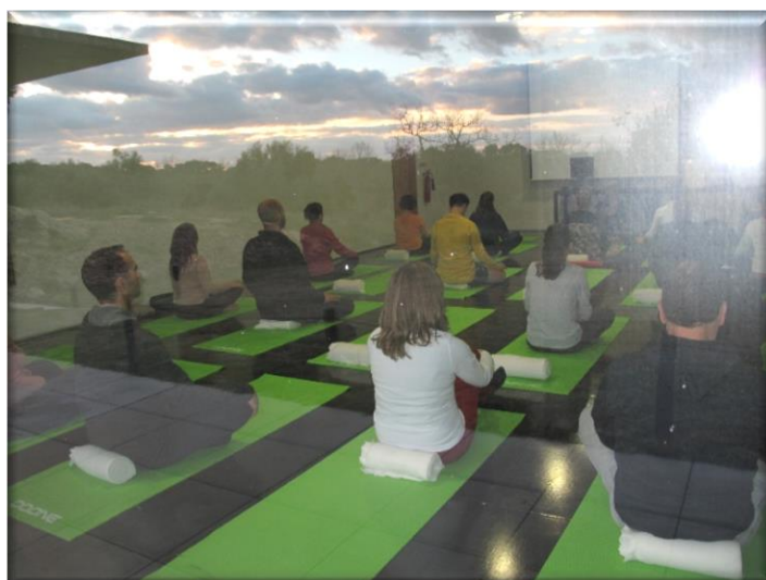
Anexo 4 - Aula experimental